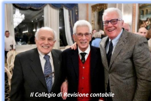
Il Collegio di Revisione contabile

di ogni tipo. Il club sarà affiancato principalmente da due psicologi, ma non sono esclusi interventi di tecnici o dirigenti di alto livello.