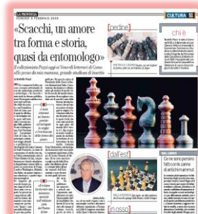
La Provincia di Como 06.02.09

Per il Panathlon Club di Como ha effettuato un'indagine sullo sport nell'antichità presentata poi ai soci con una pubblicazione (Le Olimpiadi antiche). Sempre pronto alla collaborazione (molto attivo anche